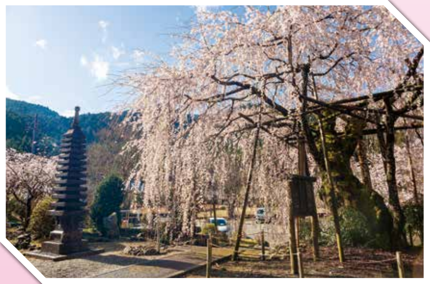
東吉野村 『宝蔵寺のしだれ桜』