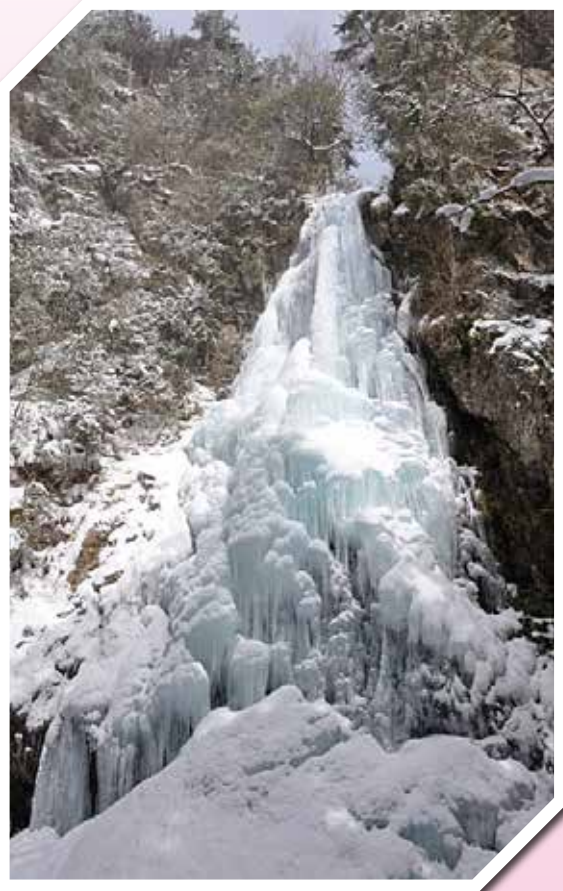
川上村 『御船の滝 氷瀑』